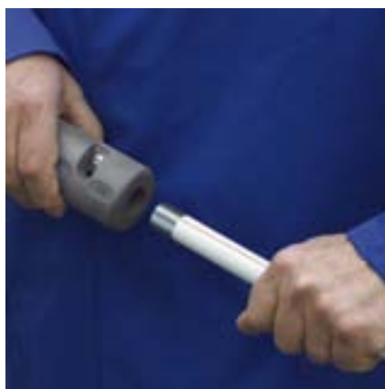
Het Viega-stripwerktuig voor de witte buitenmantel van de Prestabo-buizen.

Voor de verwerking van Prestabo heeft Viega gereedschap ontwikkeld dat een maximaal comfort en hoge zekerheid garandeert. Met het stripwerktuig verwijdert u, voor opbouwinstallaties, de witte PP-mantel van de buizen. En met het Viega-persgereedschap creëert u in een mum van tijd betrouwbare verbindingen.