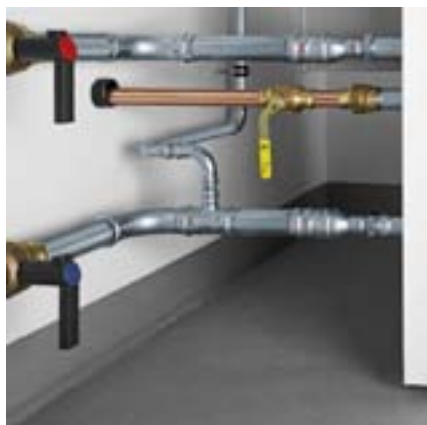
Verwarmingsetelaansluiting: aanvoer en retour met Prestabo en Easytop-kogelkranen. Gasaansluiting met Profipress G.