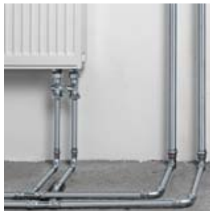
Prestabo betekent veelzijdigheid in de verwarmingsinstallatie.